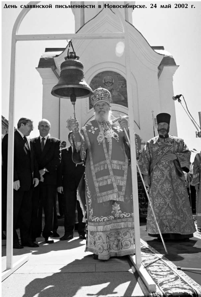
День славянской письменности в Новосибирске. 24 мая 2002 г.

Служение Его Святейшества было неразрывно связано с этой славной эпохой церковного возрождения. На наших глазах оно становится живой летописью новой России. Восстановление церковной жизни во всей ее полноте неотделимо от имени пятнадцатого Предстоятеля Русской Православной Церкви — Святейшего Патриарха Московского и всея Руси Алексия II.