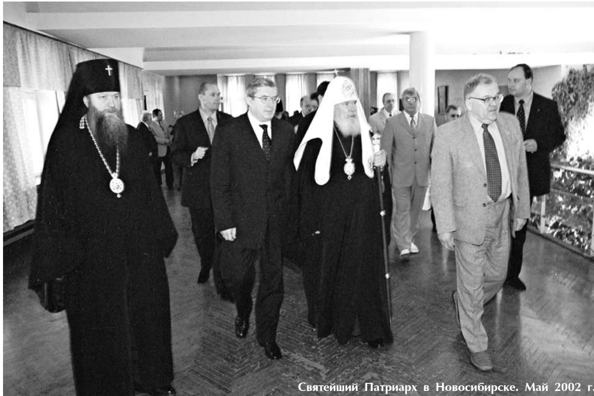
Святейший Патриарх в Новосибирске. Май 2002 г.